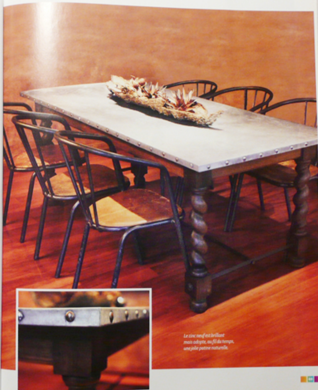
Le zinc neuf est brillant mais adoucit, au fil du temps, une jolie patine naturelle.

La touche finale. À la perceuse, Guillaume fait des trous de 7 mm de diamètre, espacés tous les 10 cm sur la tranche, dans lesquels il introduit des boulons Charron dotés d'une tige filetée de 8 mm de diamètre. Pour donner plus de cachet, il fait de les enfoncer au maillet de caoutchouc. Le plateau est ensuite vissé par en dessous sur la structure rectangulaire en bois. ■