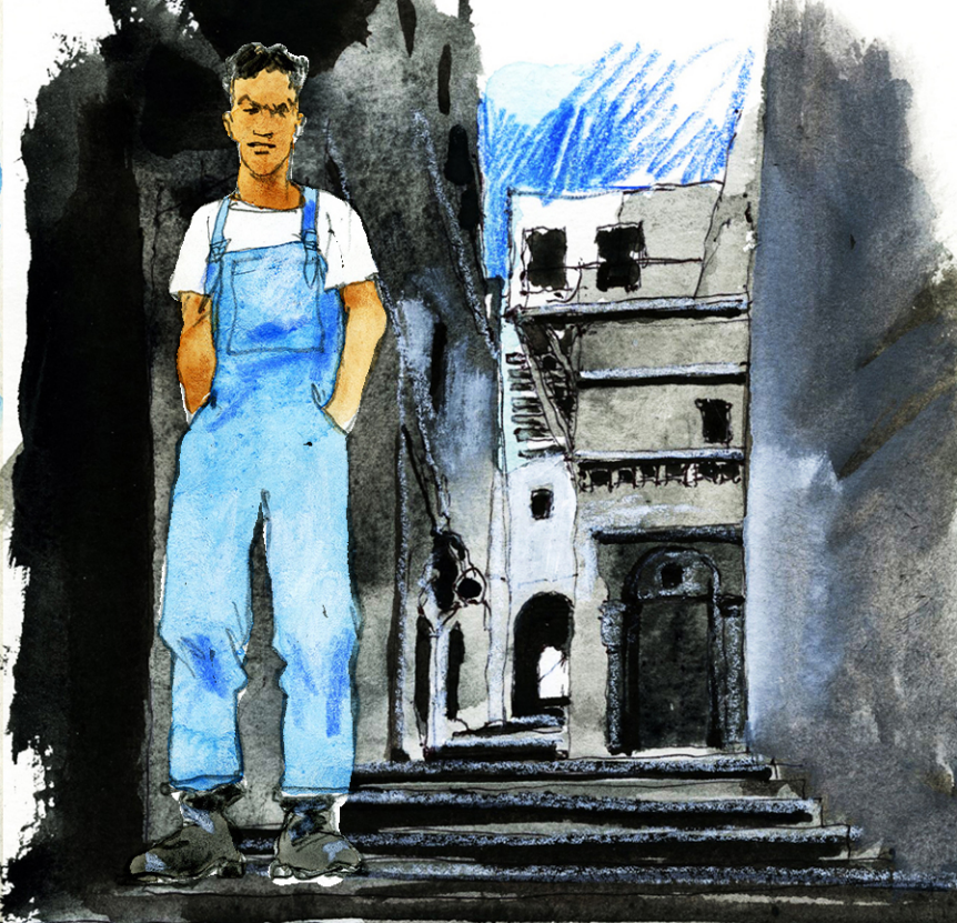
Dessins Yann Le Behec 2018